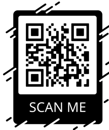
(ดร. อิชฎี กุฎอินทร์)

สมัครได้ที่ Facebook Fanpage : Thailand Flying Disc หรือ QR Code ด้านล่าง